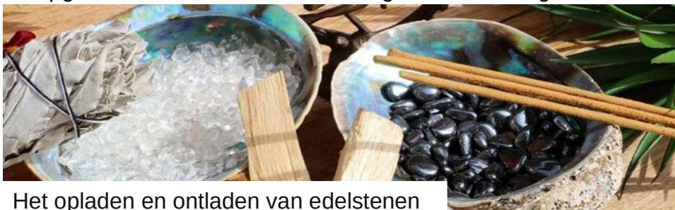
Het opladen en ontladen van edelstenen

Belangrijk is om te realiseren dat edelstenen, mineralen en kristallen leven en een bepaalde frequentie of trilling bevatten afhankelijk van hun eigenschappen. In de aarde zijn de stenen gegroeid en hebben ze energie gekregen van moeder aarde. Eenmaal uit de aarde gehaald dienen de stenen regelmatig gereinigd (ontladen) en opgeladen te worden om hun energetische werking te behouden.